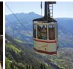
Funivia Alta Muta Tirolo