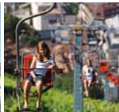
Seggiovia panoramica Tirolo-Merano