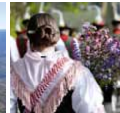
Programma culturale Escursioni guidate