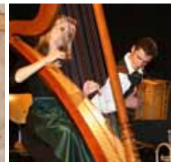
Primavera Culturale a Tirolo