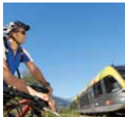
Mezzi di trasporto pubblici